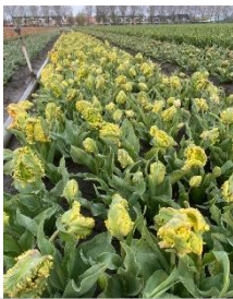
Apricot Parrot selectie zwaar parkiet Kavel nr 15-18