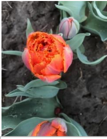
Crispa Orange Princess kavel nr 79