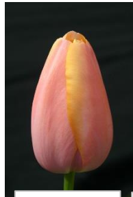
Belle du Monde®