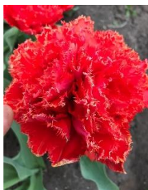
Double Crispa Rood Kavel nr 71-72