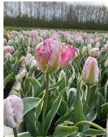
Forbidden City (parkiet New