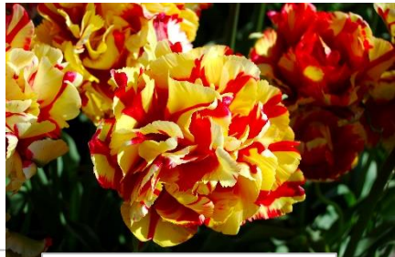
Double Flaming Parrot Kavel nr 65