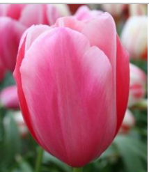
Grand Cru Vacqueyras®