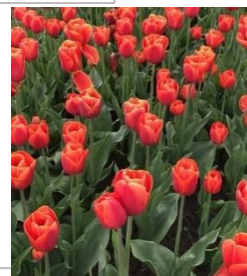
Orange enkele tulp (Tetra kruising) Kavel nr 63-64