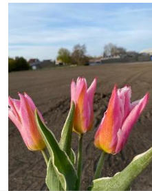
Sweet Design (Verl Royal Design Kavel nr 56