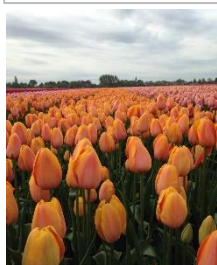
La Femme Formidable, (Diva) Verl Dordogne Kavel nr 89-90