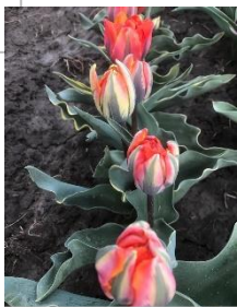
Mutant Orange Princess (bloem als Flash Point) Kavel nr 76