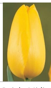
Roi du Midi